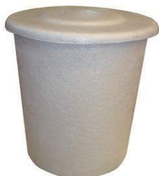
Depósito de cebado